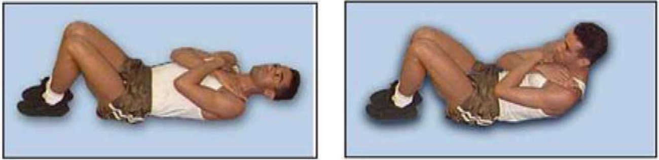
Figura 1: execução do abdominal